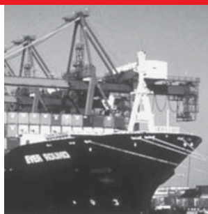
Судостроение/ Шельфовые установки