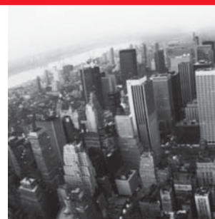
Строительство зданий/ Гражданское строительство